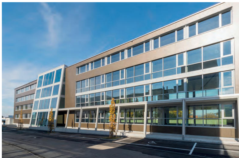
Business Center Hof, Altendorf – Immobilien im BlickPunkt – 1/2021

■ Die repräsentative Fassade und ein grosszügiges Parkplatzangebot machen das Business Center Hof auch von Aussen zu einer erstklassigen Geschäftsadresse.